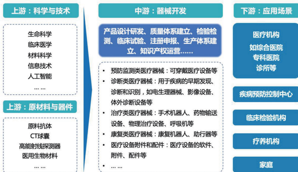
图2 数字医疗的硬件基础(医疗器械)

数字医疗发展前景广阔,技术的持续创新将引领医疗向智能化、精准化、个性化发展,数据合规